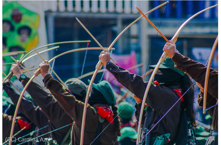
(CC) Carolina Azul