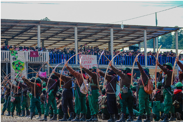
(CC) Carolina Azul