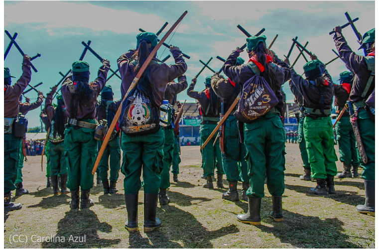
(CC) Carolina Azul

Miembro del parte de colectivo: COTRIC Colectivo Transdisciplinario de Investigaciones Críticas