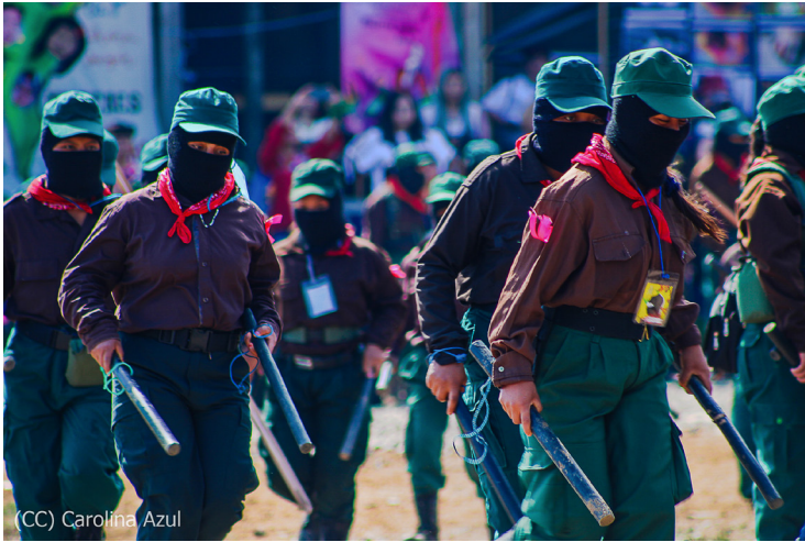
(CC) Carolina Azul